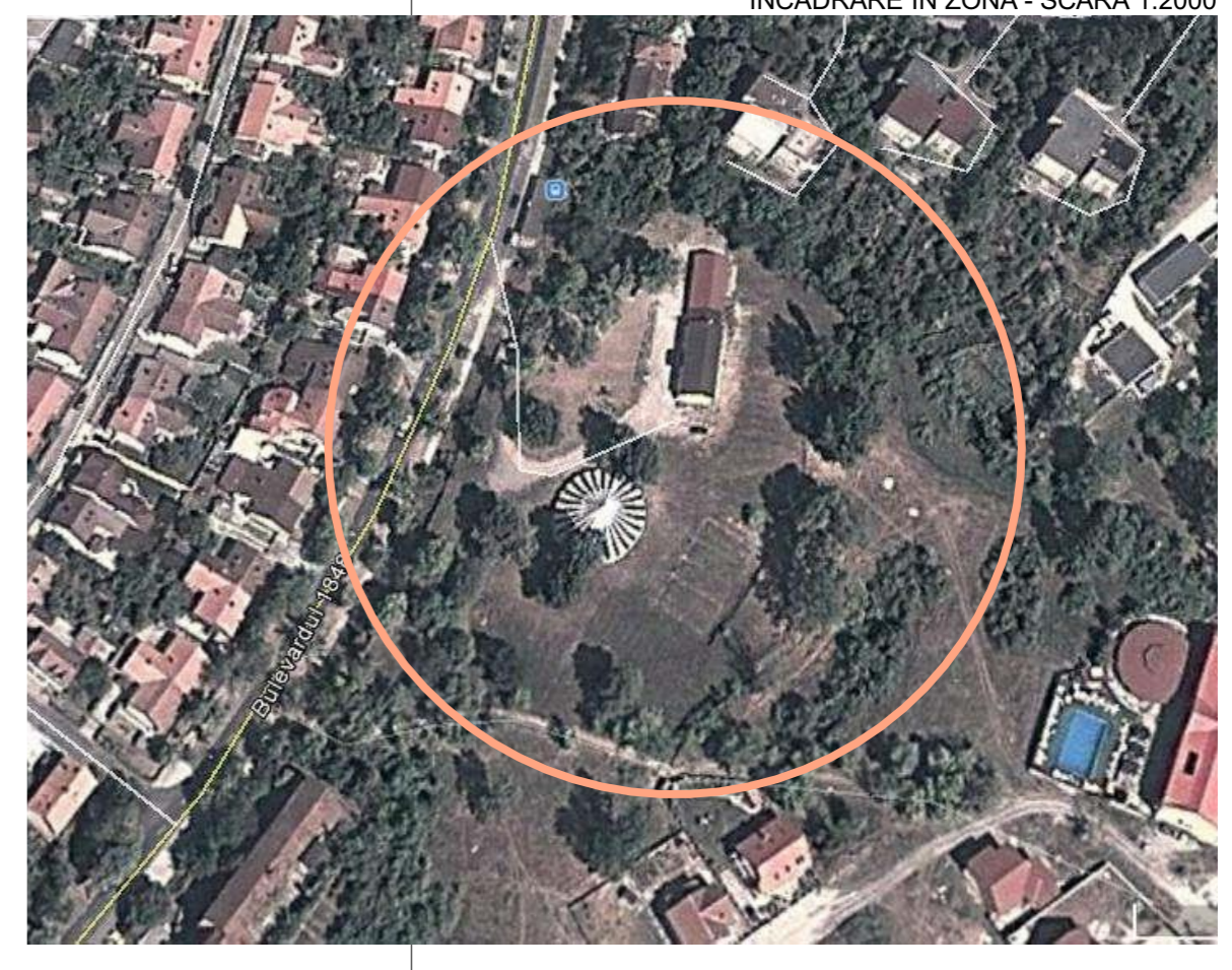
INCADRARE IN ZONA - SCARA 1:2000