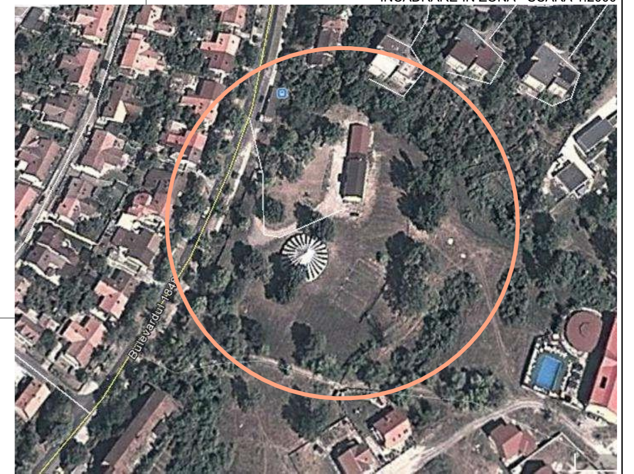
INCADRARE IN ZONA - SCARA 1:2000